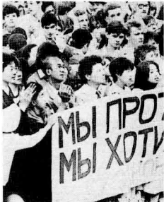
Japanse delegatieleden uiten hun protest tegen kernwapens